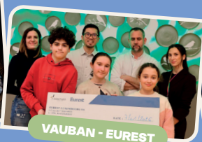
VAUBAN - EUREST