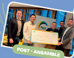
POST - ANSAMBLE