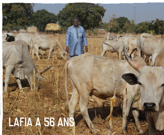
LAFIA A 56 ANS

« Grâce à ce crédit, j'ai pu me fournir en intrants supplémentaires sans avoir à sacrifier les frais de scolarité, de santé et d'alimentation de ma famille. Cela a augmenté ma production et mon revenu. Je vais aujourd'hui pouvoir construire une annexe à ma maison pour la louer et diversifier mon revenu ».