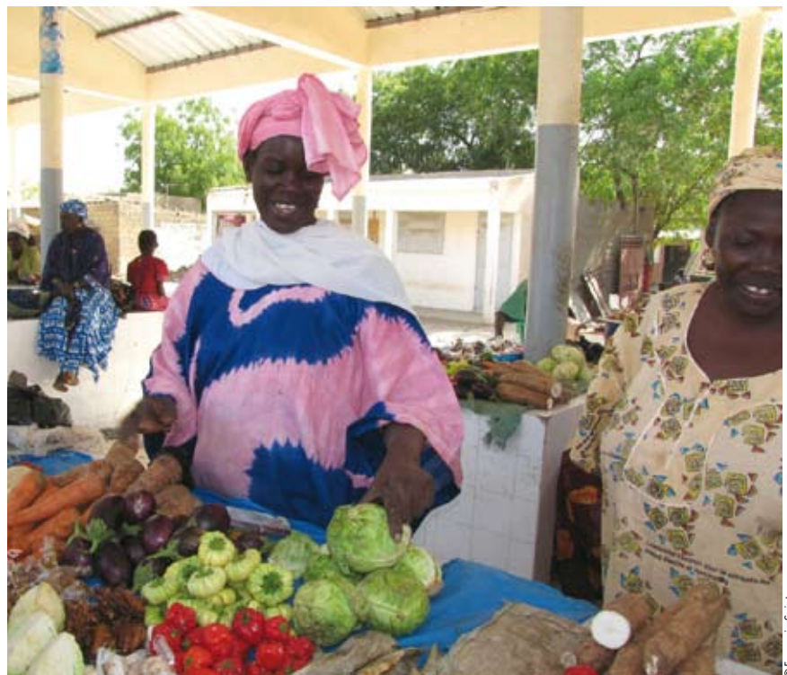
La vente de produits maraîchers est l'une des activités soutenue par les crédits

Création d'un fonds de solidarité régional (FSR) et son utilisation