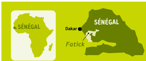
La région de Fatick au Sénégal.

enveloppe de 30 500 EURO destinée à financer des activités génératrices de revenus. Cette étape a abouti à la formulation d'une initiative d'envergure régionale qui s'est étendue progressivement de 2003 à 2007, incluant ainsi à la fois 10 unions de groupements féminins correspondant aux arrondissements (parties rurales) et 7 unions communales (correspondant aux villes de la région). Chaque union a bénéficié d'une dotation de départ de 15.245 EURO.