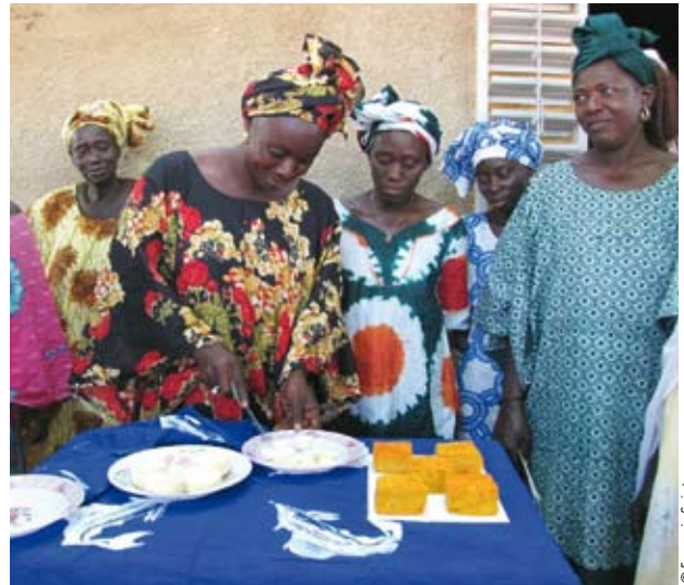
Les femmes du groupement de Mbafaye créé en 1987 produisent du fromage.

Tout en émettant une réserve liée la fongibilité des micro crédits (difficulté d'affecter directement un