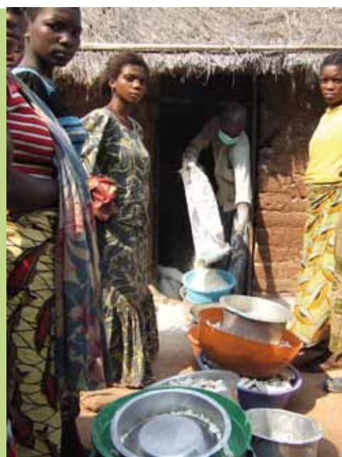
Moulin de manioc