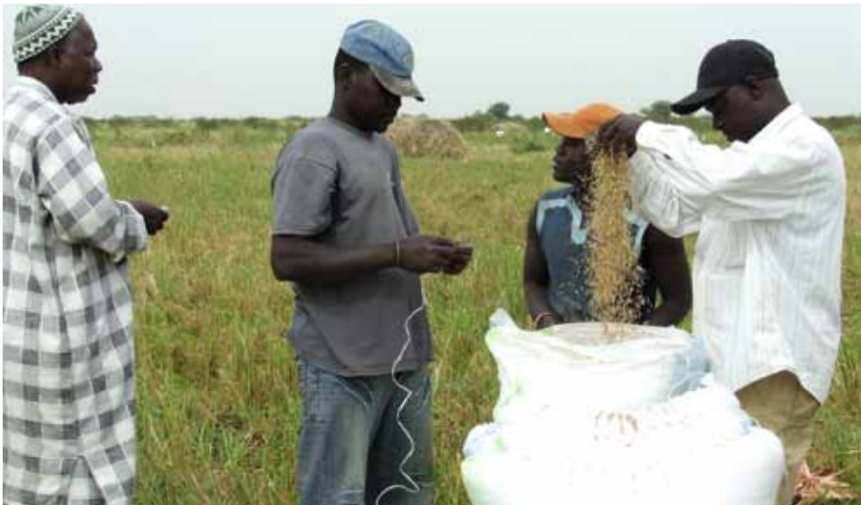
Comment utiliser les céréales sénégalaises dans le pain sénégalais ?

➤ accord avec l'Association nationale des transformateurs de céréales locales qui, à leur tour, ont passé des accords de performance avec les boulangers. L'objectif de départ était d'offrir aux consommateurs un pain de qualité à un coût relativement abordable, au moment où les cours mondiaux du blé étaient à la hausse. L'autre intention était de profiter de l'engouement que connaît la consommation de pain au Sénégal pour booster la production nationale de céréales.