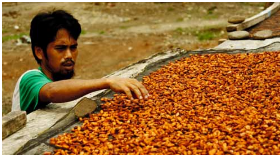
En Indonésie, le cacao est essentiellement cultivé par les petits agriculteurs.

est, quant à lui, diplômé de l'Université de Wageningen en sciences forestières tropicales. Il a travaillé, par le passé, pour la FAO au Laos et pour Hivos en Bolivie et à La Haye. Il est le représentant de Vredeseilanden en Indonésie.