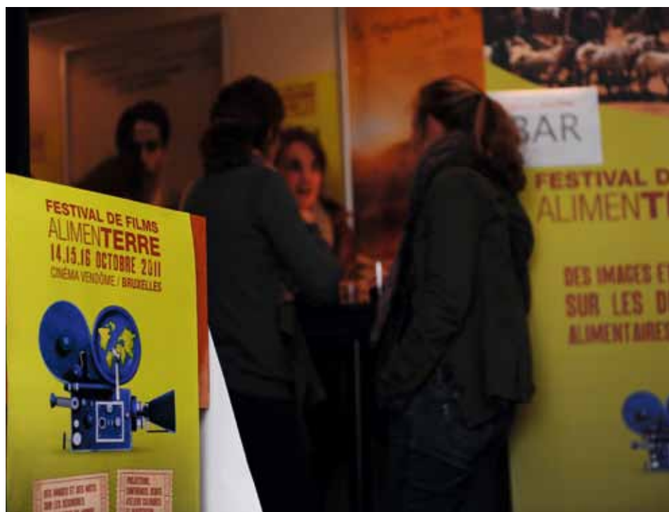
Le festival Alimenterre, au cinéma Vendôme, à Bruxelles.

Les 14, 15 et 16 octobre derniers, SOS faim a organisé le festival de films Alimenterre à l'occasion de la Journée mondiale de l'Alimentation. Cette troisième édition s'est tenue avec succès à Bruxelles mais aussi à Marche-en-Famenne et à Rossignol-Tintigny.